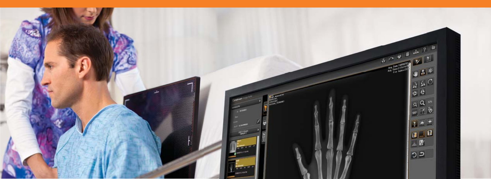
IMAGE SUITE V4: LA POTENCIA DETRÁS DEL RENDIMIENTO.