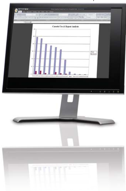
Grafico uso cassetta e analisi ripetizioni